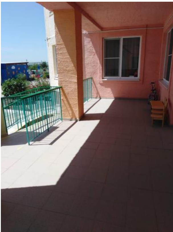
Φoto № 6